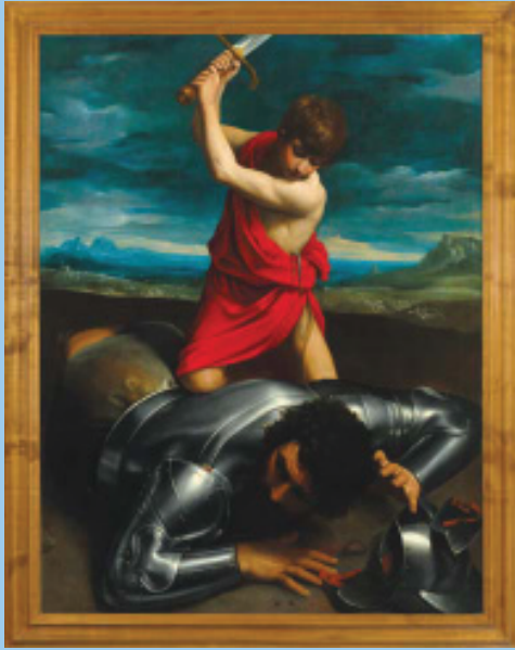
Guido Reni , David enthauptet Goliath, 1606 / 1607