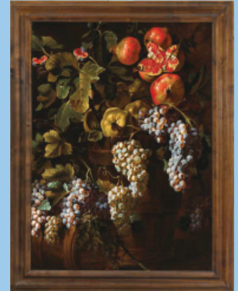
Michelangelo Cerquozzi, Stillleben mit Trauben, Quitten und Granatäpfeln, um 1640