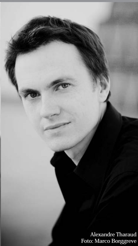
Alexandre Tharaud